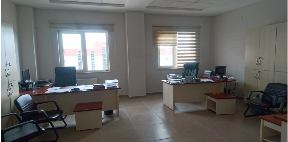
Resim 2. Farklı Açıdan Büroya Ait Görüntü