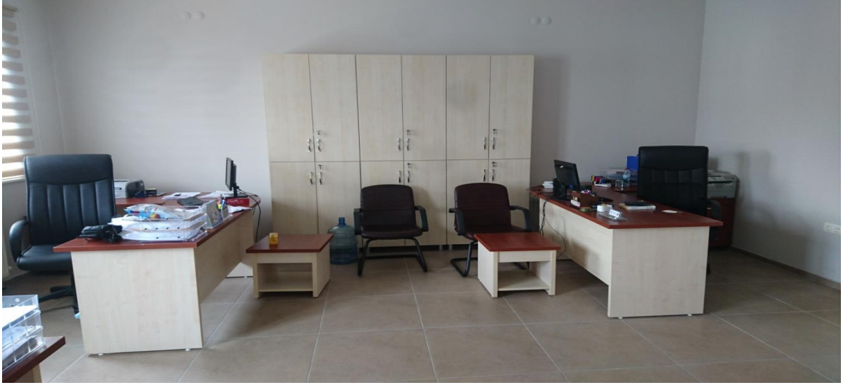
Resim 1. Büroya Ait Görüntü